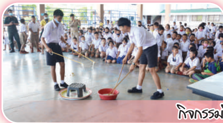
กิจกรรมกีฬาทางศาสตร์