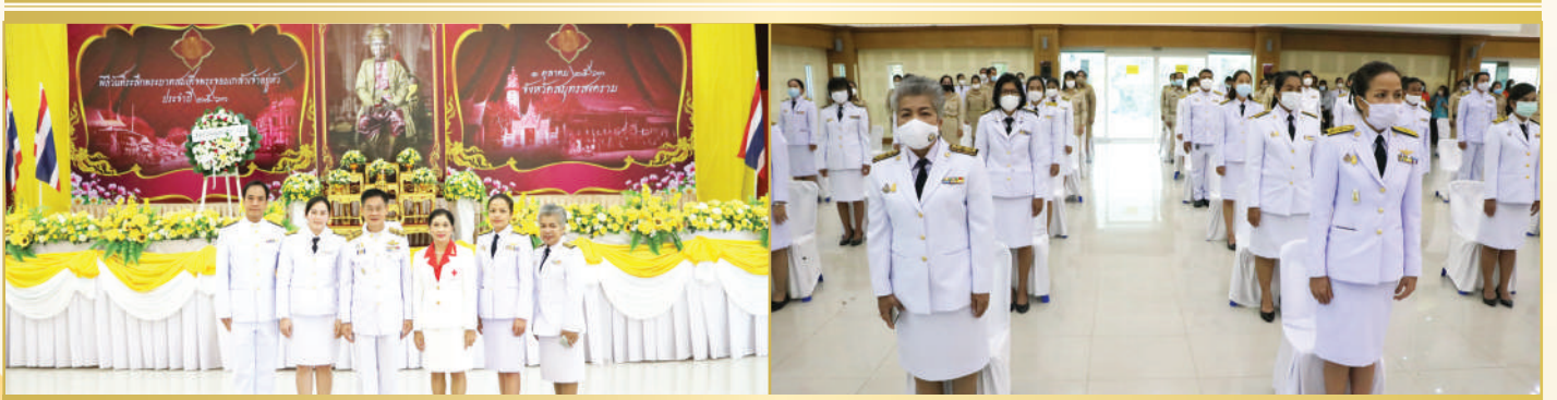
พิธีวันที่ระลึกพระบาทสมเด็จพระจอมเกล้าเจ้าอยู่หัว รัชกาลที่ ๔ วันที่ ๑ ตุลาคม ๒๕๖๓