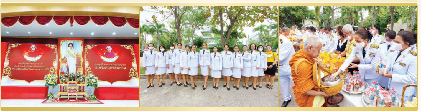
พิธีทำบุญ ตักบาตร พระสงฆ์ จำนวน ๒๕ รูป เพื่อถวายเป็นพระราชกุศลและน้อมรำลึก เนื่องในวันคล้ายวันพระราชสมภพ ครบ ๑๒๐ ปี สมเด็จพระศรีนครินทราบรมราชชนนี วันที่ ๒๑ ตุลาคม ๒๕๖๓