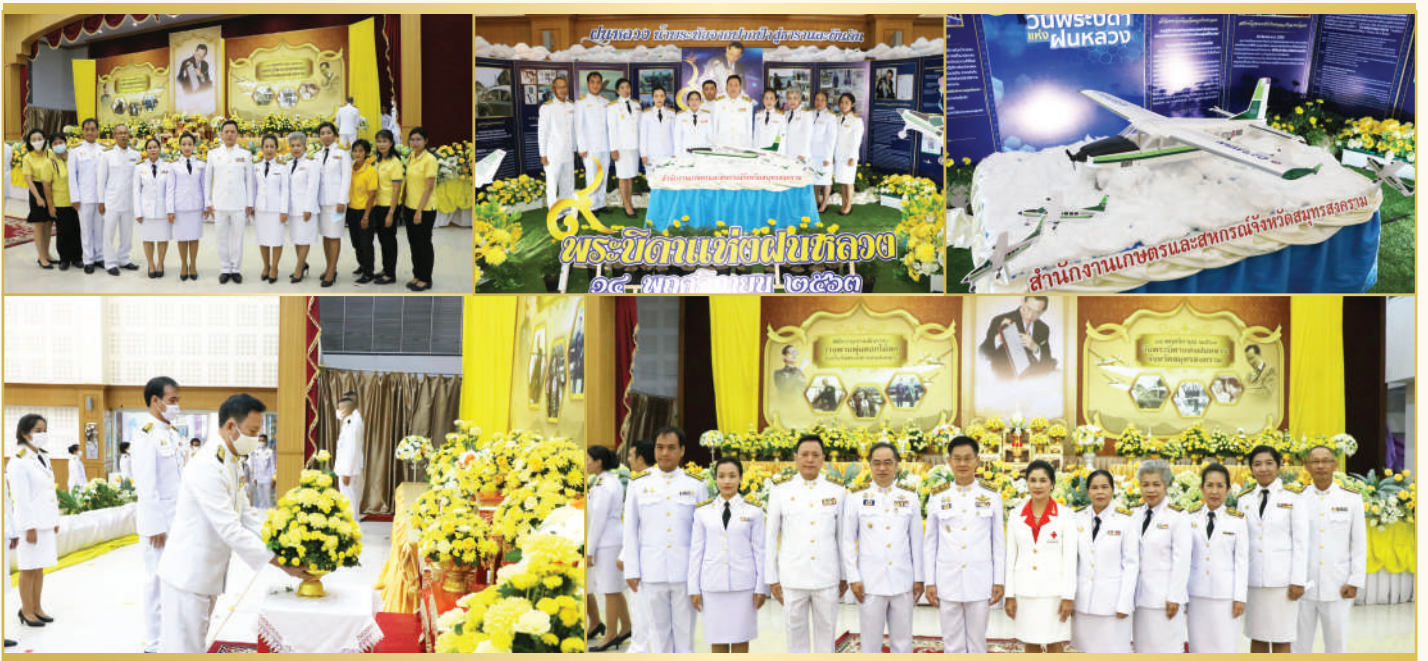
พิธีถวายราชสักการะวางพานพุ่มดอกไม้สด พระบาทสมเด็จพระบรมชนกาธิเบศร มหาภูมิพลอดุลยเดชมหาราช บรมนาถบพิตร เนื่องใน "วันพระบิดาแห่งฝนหลวง" ประจำปี ๒๕๖๓ วันที่ ๑๔ พฤศจิกายน ๒๕๖๓