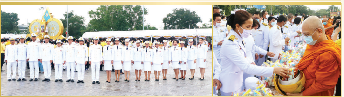
พิธีทำบุญตักบาตรพระสงฆ์ จำนวน ๘๙ รูป เนื่องในวันคล้ายวันสวรรคต ๑๓ ตุลาคม ๒๕๖๓ พระบาทสมเด็จพระบรมชนกาธิเบศร มหาภูมิพลอดุลยเดชมหาราช บรมนาถบพิตร