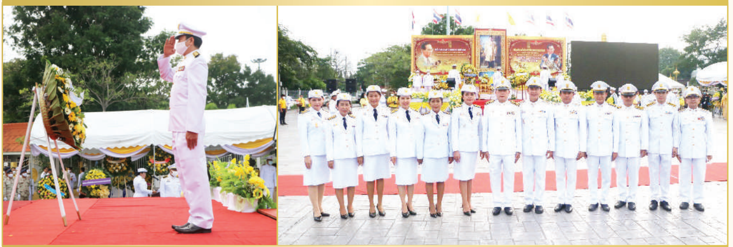
พิธีวางพวงมาลาและถวายบังคม เบื้องหน้าพระบรมฉายาลักษณ์ พระบาทสมเด็จพระบรมชนกาธิเบศร มหาภูมิพลอดุลยเดชมหาราช บรมนาถบพิตร