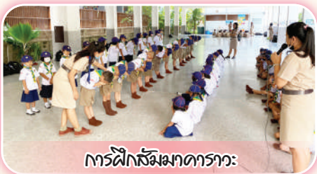
การฝึกซ้อมมาดารา: