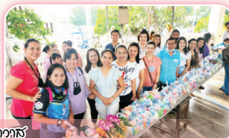
พิธีตัดกิฎาตรเนื่องในวันออกพรรษา ณ วัดประทุมคณาวาส