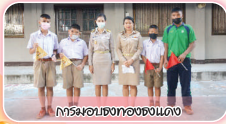
การมอบธงทองแดง