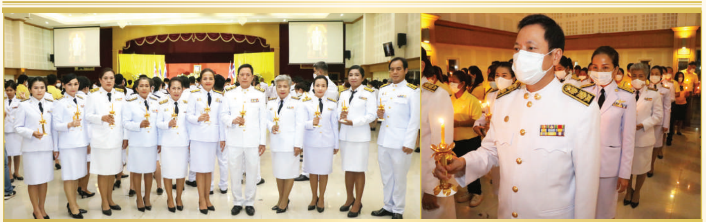
พิธีจุดเทียนเพื่อน้อมรำลึกในพระมหากรุณาธิคุณ พระบาทสมเด็จพระบรมชนกาธิเบศร มหาภูมิพลอดุลยเดชมหาราช บรมนาถบพิตร