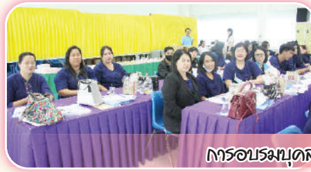
การอบรมบุคลากรทางการศึกษา