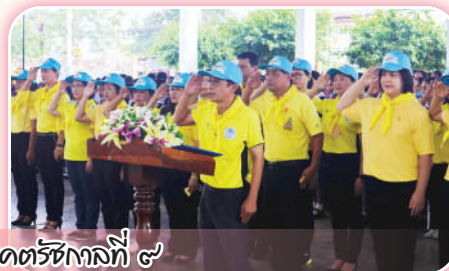
พิธีตัดกิฎาตรและกิจกรรมจิตอาสาเนื่องในวันคล้ายวันสวรรคตรัชกาลที่ ๙