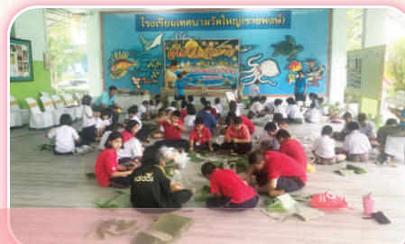
กิจกรรมวันลอยกระทง